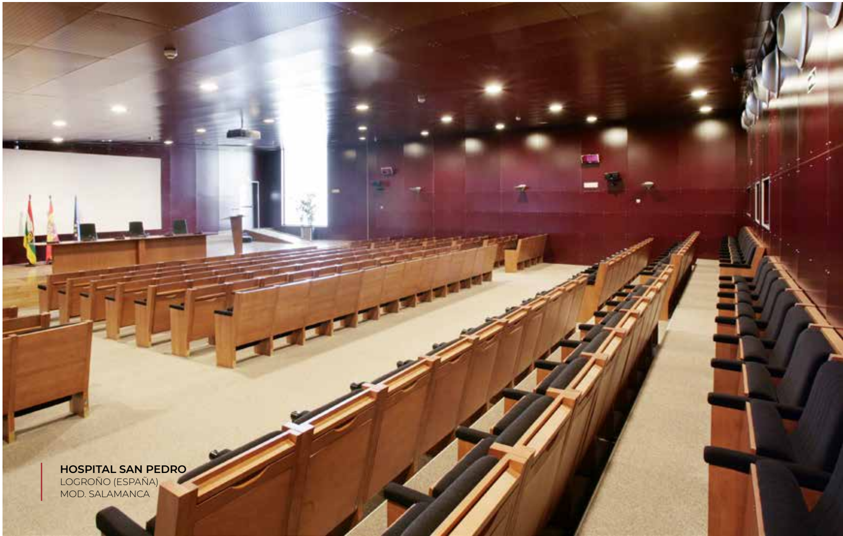
HOSPITAL SAN PEDRO LOGROÑO (ESPAÑA) MOD. SALAMANCA