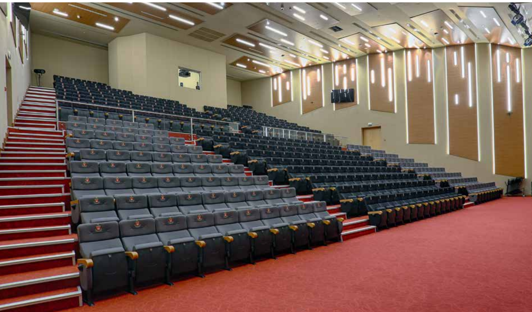
KENT COLLEGE CONFERENCE HALL DUBÁI (EMIRATOS ÁRABES UNIDOS) MOD. PRÍNCIPE