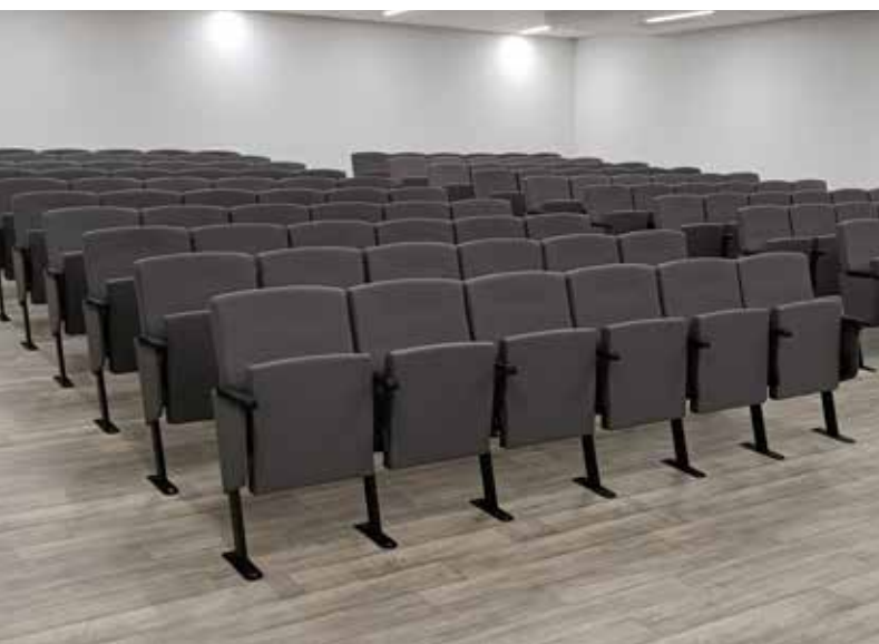
COLEGIO RICHMOND PARK SCHOOL MADRID MADRID (ESPAÑA) MOD. ENERGY