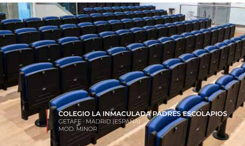
COLEGIO LA INMACULADA PADRES ESCOLAPIOS GETAFE - MADRID (ESPAÑA) MOD. MINOR