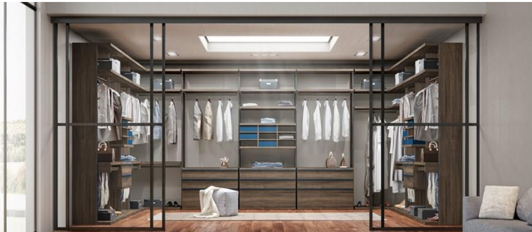
Kollektion NEW OPEN. EMEDE

Ob es sich um Schlafzimmer, Schränke oder TV-Möbel handelt, die EMEDE-Kollektionen ziehen den Betrachter auf eine filigrane und lang erwartete Art und Weise in ihren Bann. Die Oberflächen sind exquisit und bieten eine Auswahl an natürlichen, satinierten und offenporigen Furnieren, sowie Glas, Polster und Keramik . Jedes Element hat seinen Stellenwert und schreitet selbstbewusst in Richtung dieses neuen Jahrzehnts, in dem sie einfache, reine und klare Linien weitläufige Umgebungen voller Persönlichkeit und Stil bieten.