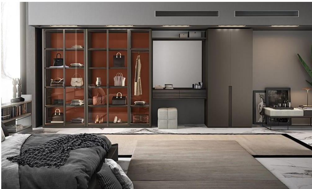
Kollektion GRIP. EMEDE

Als Hüter Ihres Stils und Ihrer Persönlichkeit sind Schränke dank EMEDE viel mehr als nur Aufbewahrungsmöbel. Schiebetüren sind eine praktische und sinnvolle Lösung, bei der Funktionalität und Design nicht im Widerspruch zueinander stehen, sondern sich in jedem einzelnen Element ergänzen. Dank dieser Tatsache können die Schränke von EMEDE modular aufgebaut werden und bieten den zusätzlichen Vorteil einer optimalen Raumausnutzung. Mit mehr als 10 Optionen, zwischen Base C, EASY, ELIS, NEO, REPLAY oder TOTEM, zeigen diese Farbnuancen von hell bis dunkel und natürliche Elemente auf.