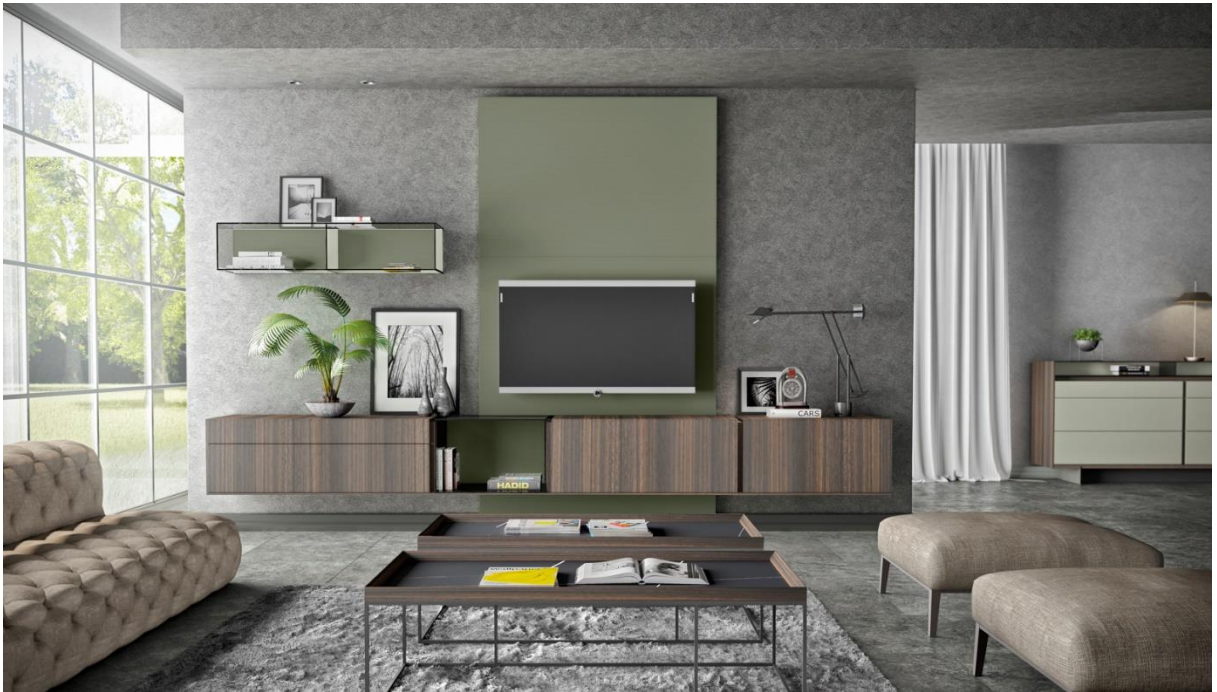
Kollektion CONNECTOR C19. EMEDE

Aus diesem Grund bietet EMEDE vier Grundmodelle an, ob stapelbar, mit oder ohne Beinstützen, mit Holz- oder Glasoberfläche, mit Falttüren oder mit Pendeltüren. Die scheinbare Schlichtheit ihrer Oberflächen verleiht ihnen gleichzeitig eine elegante und aktuelle Ausstrahlung. All dies ist das Ergebnis einer sorgfältigen Verarbeitung durch den Tischler und anhand der neuesten Technologie. CONNECTOR wird von Praderas & Lahera und dem eigenen Team von EMEDE entwickelt.,