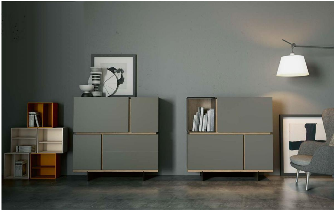
Kollektion CONNECTOR. EMEDE