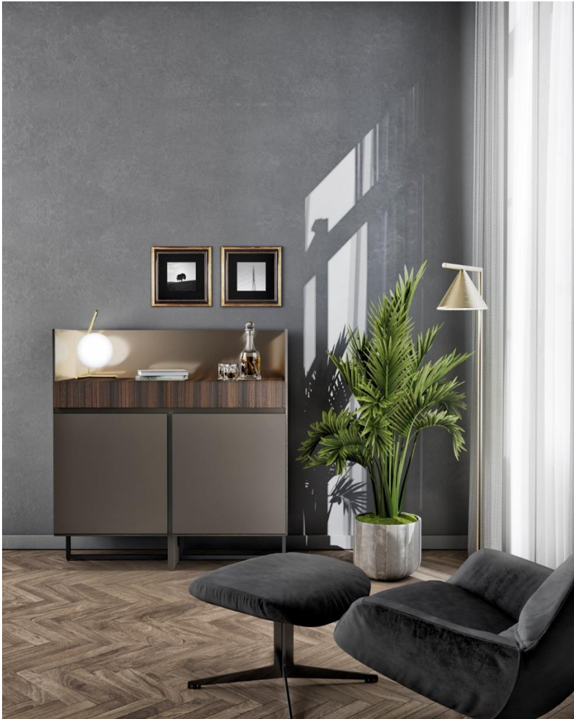
Kollektion CONNECTOR C19. EMEDE

Emede auf der IMM in Halle 10.1, Stand A030.