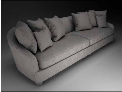
Bildsynthese Sofa Menta

Wir können 3D und 2D Dateien zur Verwendung bei Projekten zur Verfügung stellen.