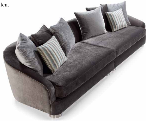
Fertiges Bild Sofa Menta