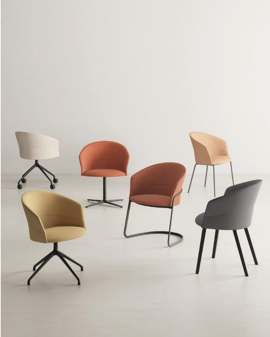
Silla Copa – diseñada por Ramos&Bassols