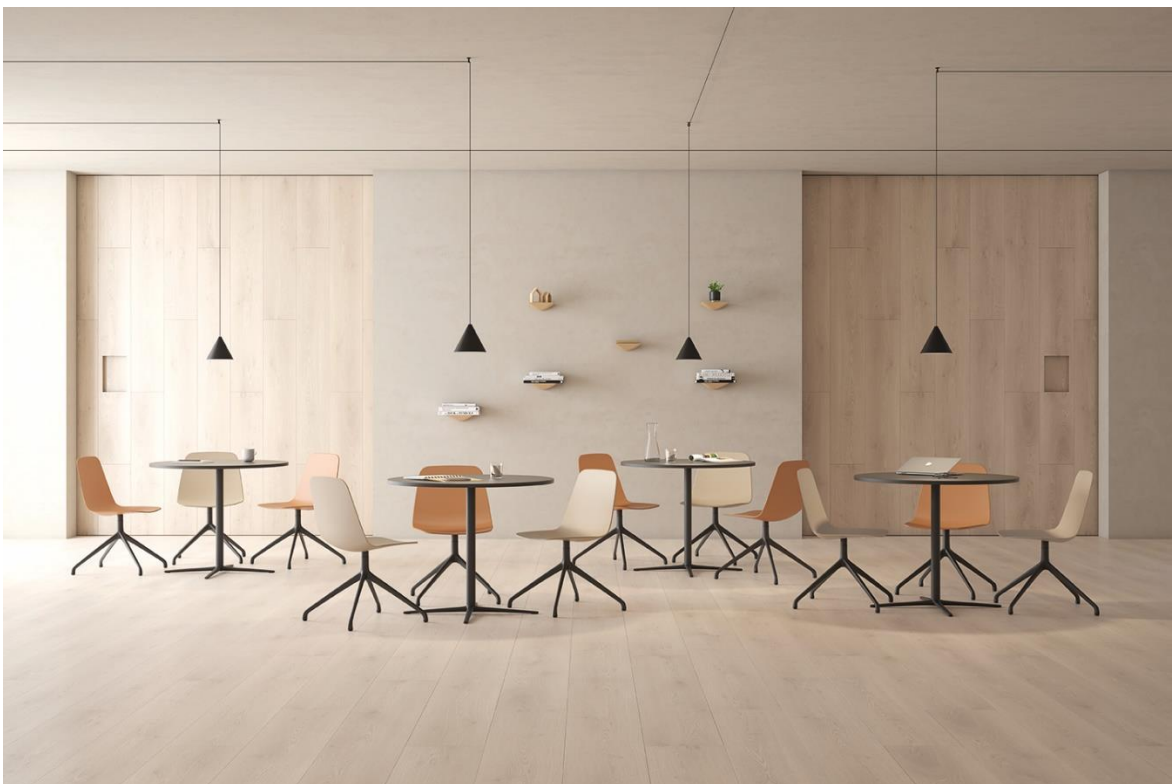
Silla Maarten Plastic – diseñada por Víctor Carrasco